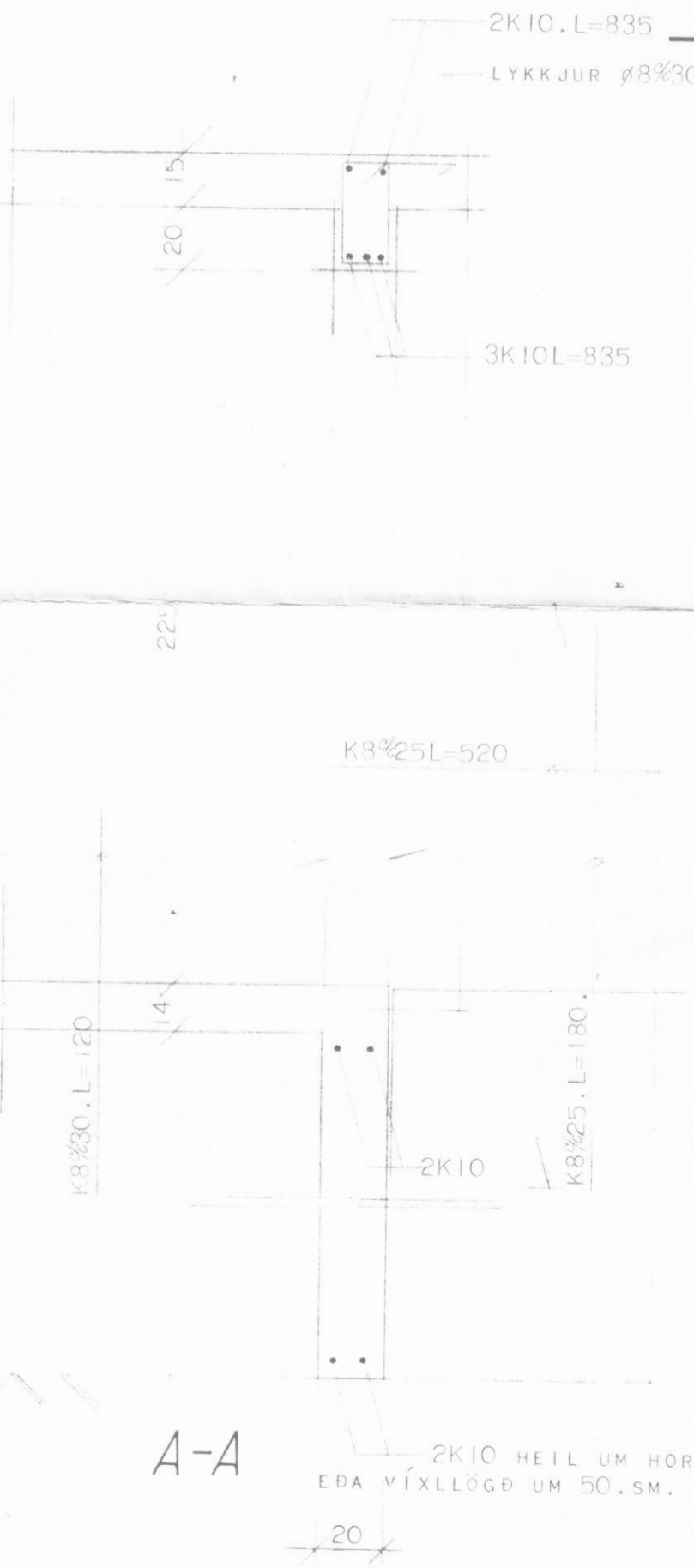
A-A 2K10 HEIL UM HOR EDA VÍXLLÖGD UM 50.SM.