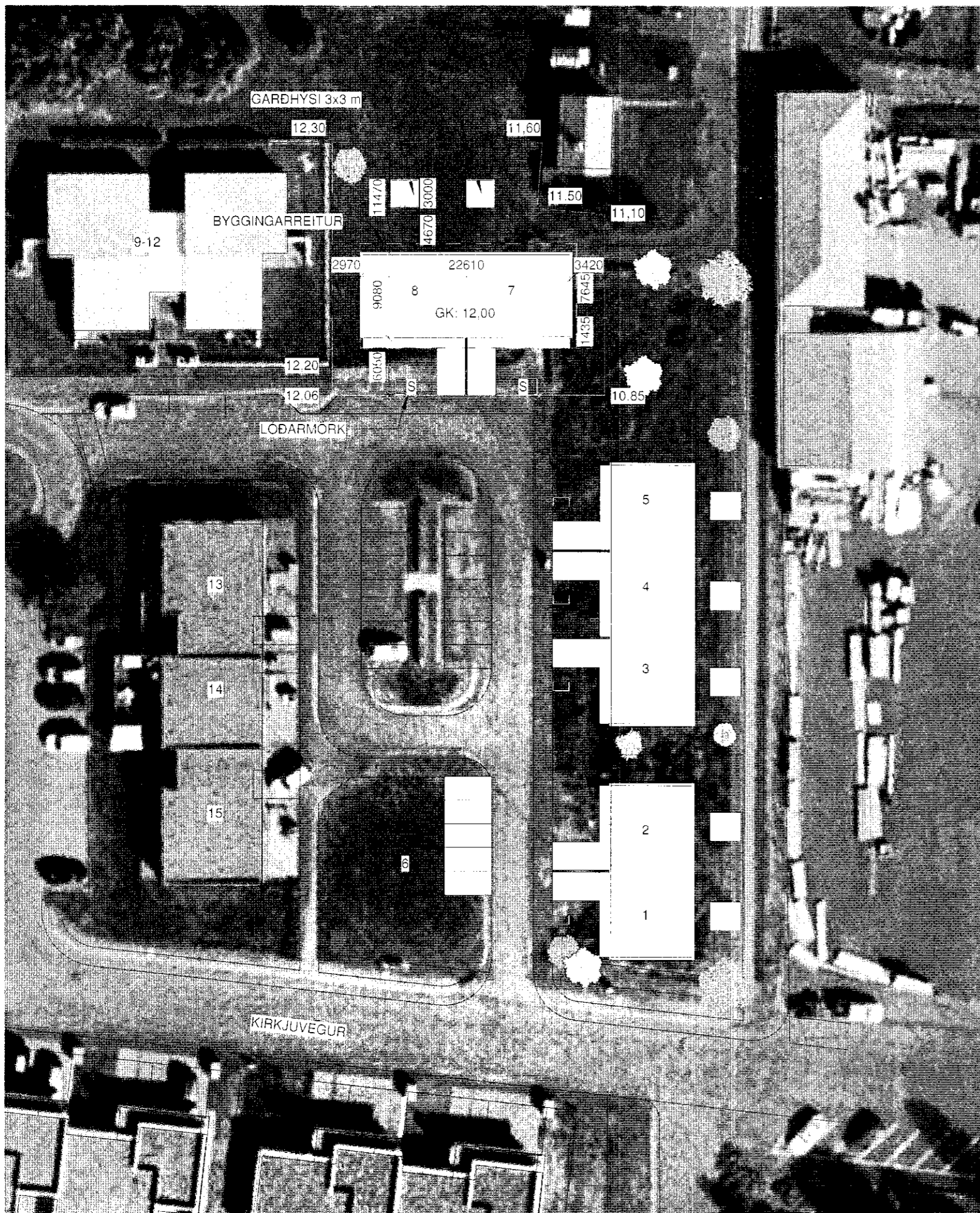
1 Lóð - Afstöðumynd 1 : 500